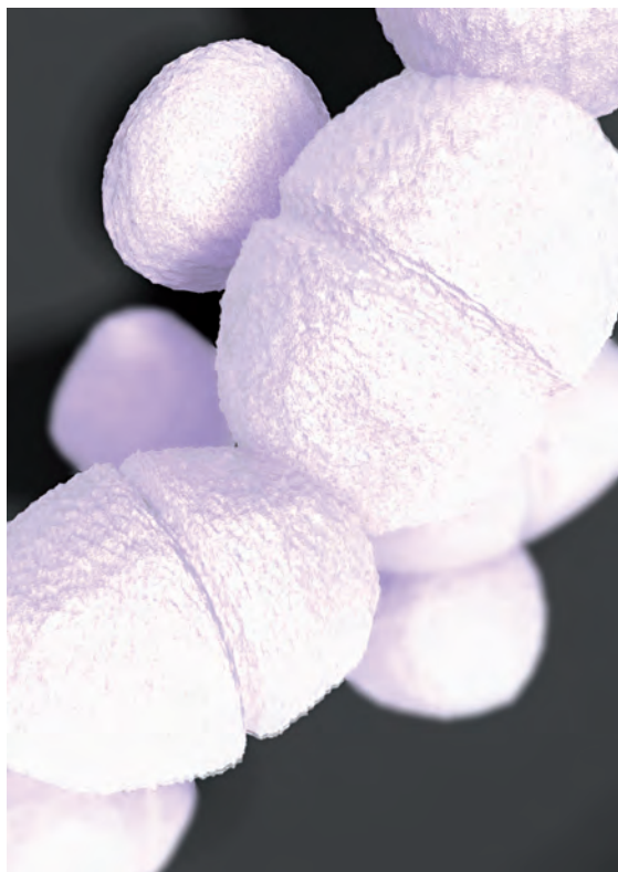
Figura 1: Enterococcus faecium SF68®